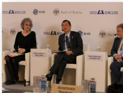
◆ロシアで開催されたパネルディスカッションの様相