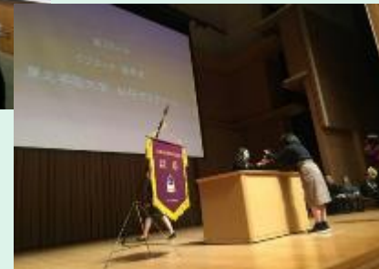
◆証券ゼミナール大会「優秀賞授与式」