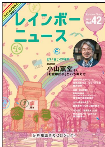
◆「レインボーニュース」 (第42号)