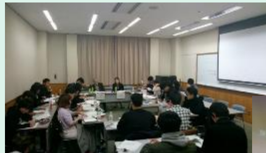
◆証券ゼミナール大会「討論」の様子