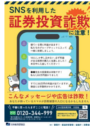
※リーフレット(A4)表面と同デザイン