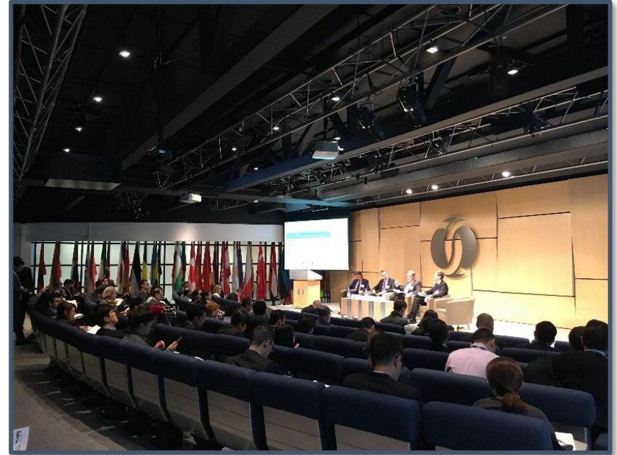
AMCC研修セミナーの様様